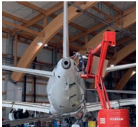
Refurbished airliner.

The refurbishment on an Airbus Airliner A319 of a Swiss airline for the first time was announced by AMAC Aerospace in the beginning of this year. Details here: www.amacaerospace.com/euroairport-24-january-2020-2/ .