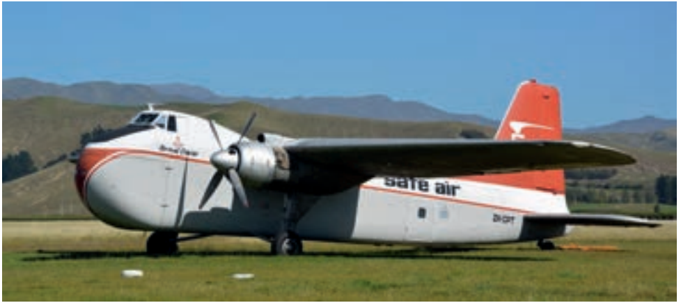
Eine Bristol 170 auf dem Flugplatz von Omaka.

waren in der Luft. Mit einer kurzen Absprache haben wir uns gegenseitig separiert, so wie es auf jedem unkontrollierten Platz funktioniert. Am Flugplatz ist ein sehr schön hergerichteter Flugzeugmuseum mit zwei Hallen beheimatet.