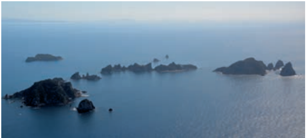
Vorgelagerte Inseln südlich von Whitianga.

Spannend und schön war der Anflug nach Whangerei. Die Anflugroute führt von Osten her übers Meer über den riesengrossen Hafen. Mit der Abendsonne war dies ein tolles Erlebnis. Die Landung auf dem grossen, ebenfalls unkontrollierten Flugplatz war perfekt. Auf dem Rollweg nahm ich viele Hangars wahr und sah auch eine Werkstatt, in der offenbar noch gearbeitet wurde. So parkte ich in der Nähe auf dem Gras, um dann mein Problem mit dem defekten Ablassventil