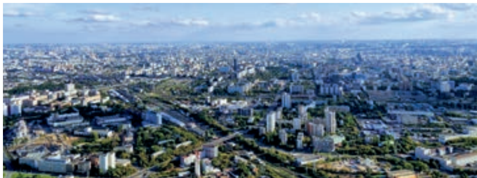
Die AOPA Switzerland führt ihr diesjähriges Fly-Out ab dem 24. August über Tallinn, St.Petersburg und Novgorod nach Moskau durch. Im Bild: Anflug in Moskau, Michael Green / Unsplash.

Im Rahmen des WEF ist gemäss Flughafen Zürich erstmals ein Businessjet mit Öko-Kerosin betankt worden, das aus Abfallstoffen und Altöl gewonnen wird. Die Aktion am Flughafen Zürich während des WEF war ein Pilotprojekt in Zusam-