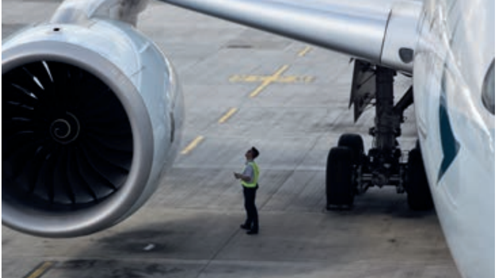
«Ältere, Treibstoff verbrauchende Flugzeuge sind privilegiert (...)»

international herumfliegen dürfen und die national zertifizierten (meist gewichtsmässig darunter, wenn nicht andere Gründe vorliegen), die national und nur unter erschwerten Umständen international herumfliegen dürften. Der überragende Unterschied ist, dass bei den nationalen Flugzeugen (wie Ultra Light und ähnliche) nicht zertifizierte Bauteile, wie eben die Motoren, verwendet werden dürfen. Rotax ist ein solcher Motor: Zuverlässig, leicht, verbrauchsfreundlich, leise und leistungsfähig. Aber weil er nicht zertifiziert ist, darf er in international zertifizierten Flugzeugen nicht verwendet werden. Die Folge ist, dass moderne, leichte, aerodynamisch ausgezeichnete Flugzeuge fliegerisch unverständlichen Einschränkungen unterworfen werden, wohingegen ältere, schwere, Treibstoff verbrauchende und aerodynamisch veraltete Flugzeuge privilegiert sind und diesen Einschränkungen nicht unterworfen sind. Alt vor neu: Unverständlich, aber wahr.