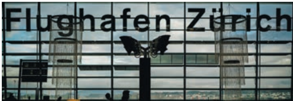
Im Rahmen des WEF ist gemäss Flughafen Zürich erstmals ein Businessjet mit Öko-Kerosin betankt worden, das aus Abfallstoffen und Altöl gewonnen wird.

Eine Abgabe auf jeden Privatflug mit Start in der Schweiz soll erst ab 5,7 Tonnen Startmasse fällig werden. Das beschloss die Nationalratskommission in der Wintersession. Die Leichtaviatik soll von der einer Flugabgabe, wie sie der Antrag von Ständerat Thomas Minder gefordert hatte, ausgenommen sein. Der Aufwand zur Erhebung der Abgabe sei angesichts der meist geringen Kosten solcher Flüge unverhältnismässig, sagt Kommissionspräsident Bastien Girod. Für Privatjets über 5,7 Tonnen hat die vorberatende Kommission des Nationalrats den Höchstbetrag im Vergleich zum Ständerat, der eine einheitliche Abgabe von 500 Franken vorsieht, stark heraufgesetzt: Die Abgabe auf Flüge aus der Schweiz soll, abhängig vom Gewicht, 500 bis maximal 5000 Franken betragen. Erhoben wird die Abgabe direkt beim Flugzeugbetreiber. ●