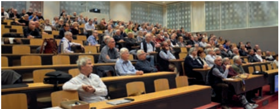
Impression des Flight Safety Seminar 2020.