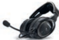
BOSE A20 mit Bluetooth CHF 1125.— sofort lieferbar

Mein Fluglehrer machte mir gerade klar, dass man das ATIS in Sion leider nicht empfangen könne, bevor man den dortigen Tower aufrufe, denn die Berge seien im Weg. Ich sagte „kein Problem“, drückte auf den Bluetooth-Knopf meines neuen BOSE-A20-Headsets und sagte meiner Smartphone-Assistentin, sie solle den Kontakt „ATIS Sion“ anrufen.