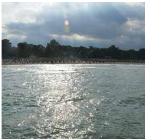
Abendstimmung in Timmendorfer Strand (Ostsee).

Am Montag sollte die letzte Landung in Lübeck um 1500 Uhr erfolgen. Dies gelang uns auch, obschon die Gegenwindkomponente bis zu 30 Knoten betrug. Aus diesem Grund war eine Landung in Braunschweig zum Auftanken unausweichlich, weil unsere Geschwindigkeit zuweilen 60 Knoten betrug. Jedes Auto auf den Autobahnen unter uns war schneller unterwegs. Die Wolkendecke hat sich auf eine angenehme Art gehoben, so dass die Sicht auf rund 1'500 Fuss über Grund stets ausreichend war.