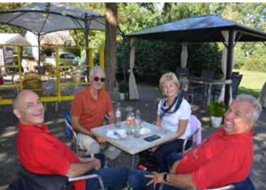
Vesperzeit in Peenemünde.

Schnell wurden wir mit einem Bus zum Flugplatz gefahren. Alsbald verabschiedeten wir uns gegenseitig und wünschten gute Heimflüge, obschon das Wetter sich nicht von der schönsten Seite zeigte. Fliegbar war es aber allenthalben. Einige Crews füllten noch die Flugzeugtanks voll, so auch wir mit unserer C152.