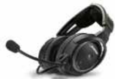
BOSE A20 mit Bluetooth CHF 1125.— sofort lieferbar

Mein Fluglehrer machte mir gerade klar, dass man das ATIS in Sion leider nicht empfangen könne, bevor man den dortigen Tower aufrufe, denn die Berge seien im Weg. Ich sagte „kein Problem“, drückte auf den Bluetooth-Knopf meines neuen BOSE-A20-Headsets und sagte meiner Smartphone-Assistentin, sie solle den Kontakt „ATIS Sion“ anrufen.