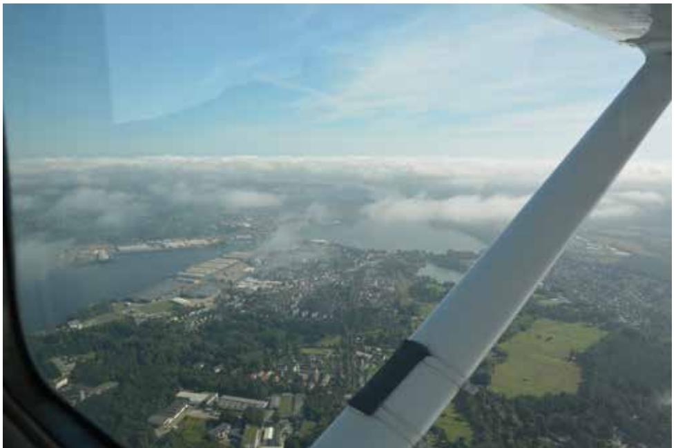
Auf dem Anflug zum Flughafen Lübeck.

Flug in den Norden anzutreten. Die VFR-Wettervorhersagen waren nicht gerade berauschend. Es war von Anfang an klar, dass ein «taktischer Tiefflug» angesagt ist (da kam uns die C152 sogar sehr gelegen). Wir beschlossen, den EU-Ein-