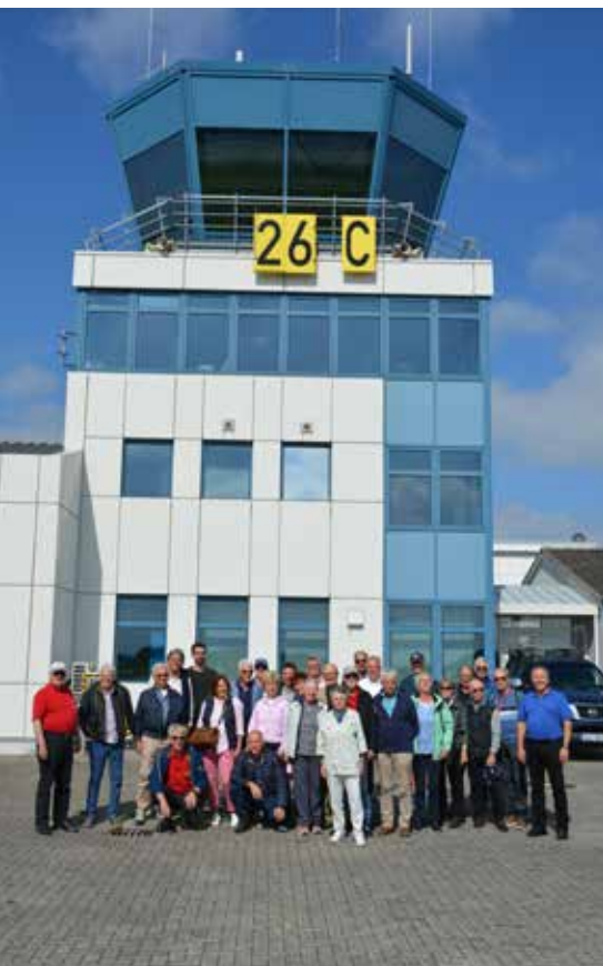
Gruppenbild auf dem Flugplatz in Kiel.

Ein Bus führte uns alsbald in der topfebenen Gegend rum. In Timmendorfer Strand, einem sehr