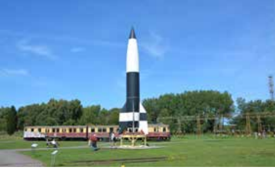
Die berühmte V2 auf dem Versuchsgelände in Peenemünde.

«Bald waren all unsere Flugzeuge wieder gestartet und flogen in einer wunderschönen Abendstimmung heimwärts nach Lübeck.»